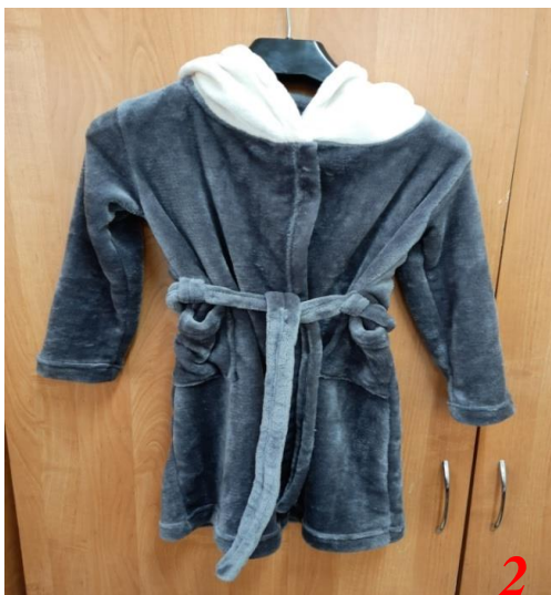
Фото 2 – нарушение по показателю безопасности: «гигроскопичность» составила для халата детского «Вульф» - 1,2% при норме не менее 6% (дошкольная группа). Запрещено к ввозу и обращению на территории Республики Беларусь предписанием Госстандарта №06-11-123/214 от 16.03.2022.