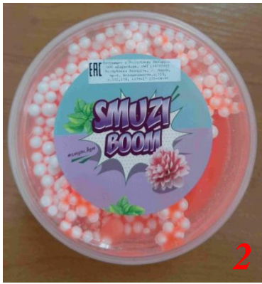
Фото 2 – нарушение по показателю гигиенической безопасности «уровень миграции формальдегида» при норме не более 0,1 \text{ мг/дм}^3 составил более 0,5 \text{ мг/дм}^3 . Запрещено к ввозу и обращению на территории Республики Беларусь предписанием Госстандарта №06-11-123/571 от 08.06.2022.