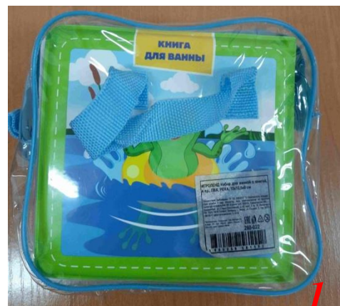
Фото 1 – нарушение по показателю гигиенической безопасности «уровень миграции фенола» при норме не более 0,05 мг/дм 3 составил 0,403 мг/дм 3 . Запрещено к ввозу и обращению на территории Республики Беларусь предписанием Госстандарта №06-11-123/571 от 08.06.2022.

- наличие продукции без документов об оценке соответствия.